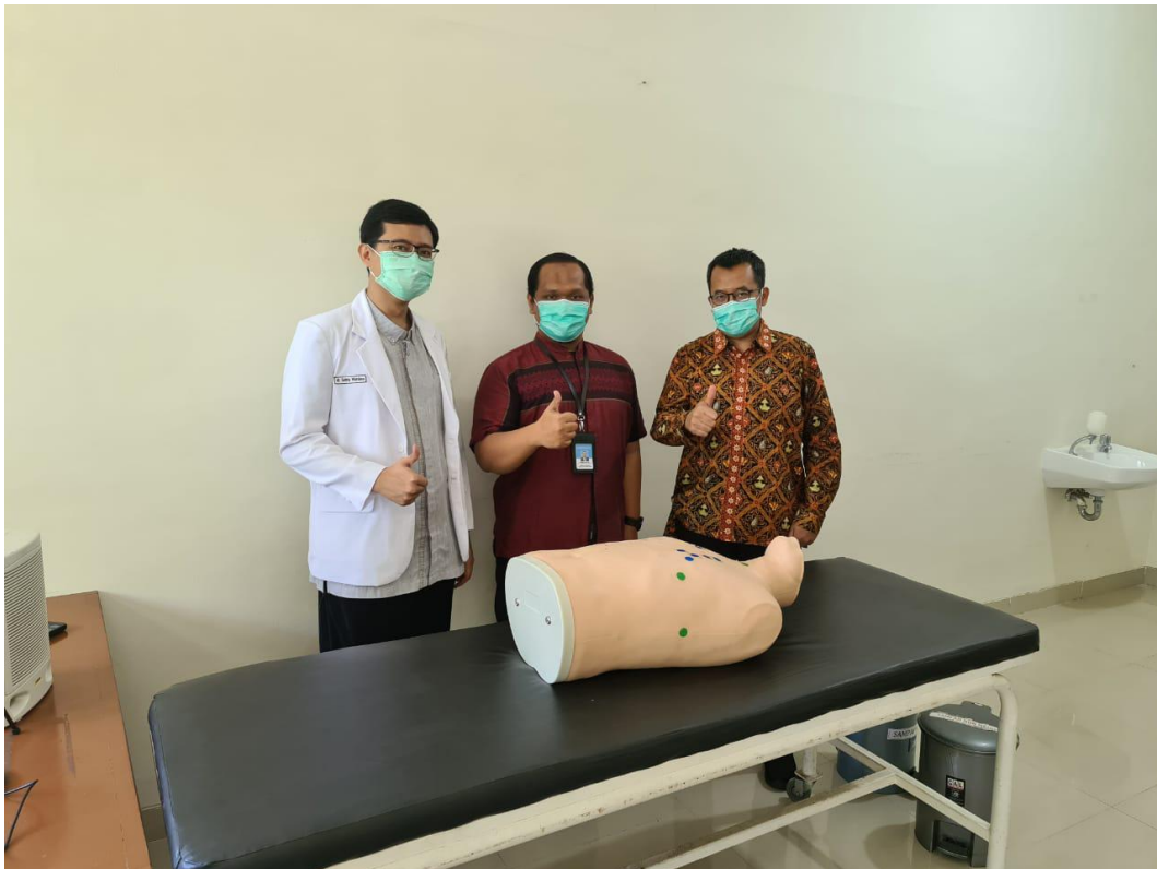
Gambar 1. Kegiatan pembuatan video pemeriksaan paru yang dilaksanakan pada 14 Agustus 2020 sampai dengan 31 Agustus 2020

Pelatihan Dasar Calon Pegawai Negeri Sipil juga menerapkan agenda habituasi sebagai salah satu kurikulum pembentukan karakter PNS. Pembelajaran Agenda Habituasi berkaitan dengan mata pelatihan yang telah dipelajari (mata pelatihan Wawasan Kebangsaan dan Nilai-Nilai Bela Negara, Analisis Isu Kontemporer, Kesiapsiagaan Bela Negara, Akuntabilitas PNS, Nasionalisme, Etika Publik, Komitmen Mutu, Anti Korupsi, Manajemen ASN, Pelayanan Publik, serta Whole of Government ). Sehingga nantinya, PNS diharapkan mampu melaksanakan peran dan kedudukannya dalam menginternalisasi berbagai nilai tersebut di unit kerjanya masing- masing agar menjadi PNS yang profesional. Penulis yang merupakan dosen di fakultas kedokteran UNS mengambil tema pembelajaran di masa pandemic sebagai tema kegiatan aktualisasi. Kegiatan aktualisasi ini dilaksanakan pada tanggal 14 Agustus sampai dengan 25 September 2020 di lingkungan fakultas kedokteran UNS.